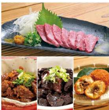
阿蘇とり宮「馬づくしセット」 阿蘇市一の宮