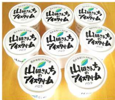
山田牧場「濃厚アイスクリームセット」 阿蘇郡西原村小森