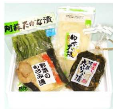
(資)江藤加工食品「阿蘇高菜漬セット」 阿蘇市黒川

上記逸品の他にも、豊富な湧き水が生んだ南阿蘇村の「久木野そば」や明治3年創業「豊前屋本店」の醤油・味噌、天然酵母パンで有名な南阿蘇村の人気店「めるころ」の洋菓子、手作りにこだわり本場ドイツ食品加工テストで金賞を受賞したこともある「ひばり工房」のハムやソーセージなど、多数の“うまかもん”を取り扱います。