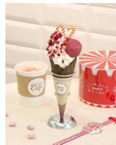
「Swatch Raspberry Chocolate Mocha」(左)

ドリンク: Swatch Raspberry Chocolate Mocha(スウォッチ ラズベリー チョコレート モカ) 450円(税込)