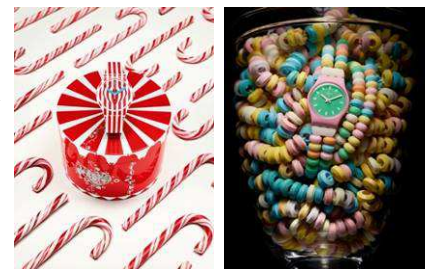
左:「スイート・バレンタイン」(8,925 円/税込) 右:「ペストリー・シェフ」【カラメリッシマ】 (6,825 円/税込)

「Swatch In Love with Cafe」では、バレンタインモデル「スイート・バレンタイン」、2014年スプリング・コレクションから「ペストリー・シェフ」といった新作の発売を記念したもので、デザイン性の高い「Swatch」のコレクションが、他にはない品ぞろえで展開されます。期間中は、「Candy・A・Go・Go」の人気企画であるキャンディビュッフェや、HUMAN BEAT BOX のライブなど、スイートな時間を演出するイベントを開催します。また、店内にはスイートなひと時をカタチにできるフォト・ブースが設置され、写真を投稿すると素敵な賞品がプレゼントされるキャンペーンなども開催します。隣接する「OMOHARA Cafe」では、「Swatch In Love with Cafe」をイメージして特別に作られたドリンクとフードの限定メニューを提供します。