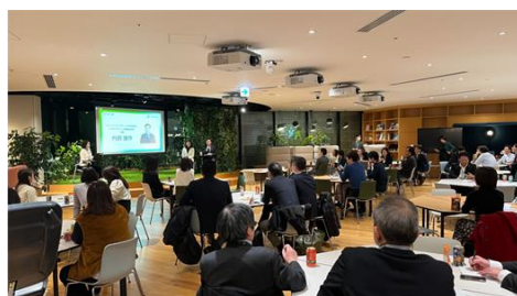
サントリー様を招待し、サステナビリティに関する パネルディスカッションを実施