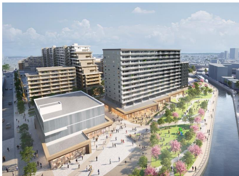
外観イメージ ※現時点のイメージであり変更となる可能性があります