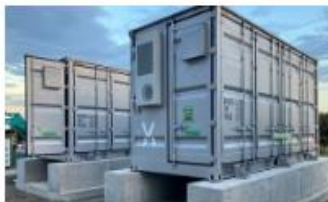
リエネ東松山蓄電所 （埼玉県東松山市）