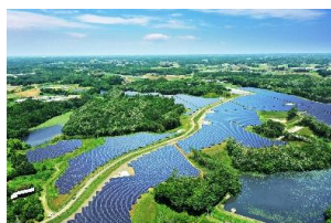
リエネ行方太陽光発電所 （茨城県行方市）

系統用蓄電池事業は 2023 年より開始し、埼玉県東松山市でリエネ東松山蓄電所（2MW）を 2025 年 1 月に運転開始、その他、全国で 340MW の開発を進めております。