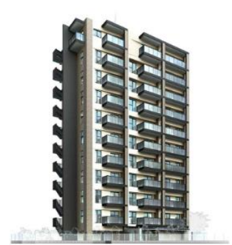
ルジェンテ新丸子 (外観完成予想CG)