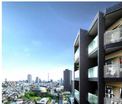
ルジェンテ新宿御苑前 (外観完成予想CG)