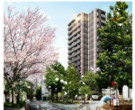
ルジェンテ文京湯島 (外観完成予想CG)