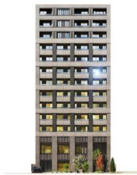
ルジェンテ上野黒門町 (外観完成予想CG)