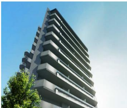
ルジェンテ日暮里ガーデン (外観完成予想CG)