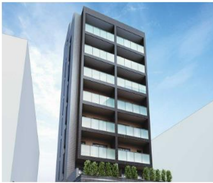
ルジェンテ池袋立教通り (外観完成予想CG)