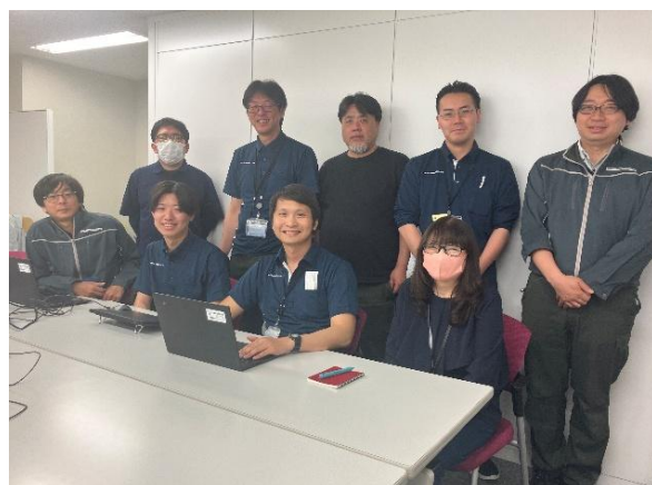
東海支社技術センター技術診断チームメンバーとともに