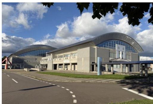
<画像左> 東急コミュニティー アリーナ 倶知安外観