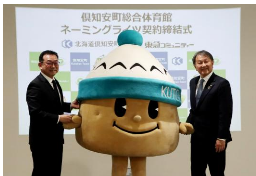
<画像左> 倶知安町のイメージキャラクター「じゃがたくん」