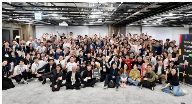
渋谷区主催イベントでの SDS 活用事例

渋谷区と東急不動産は、渋谷におけるスタートアップ・エコシステムの形成を目指し、さらなる連携および相互支援を強化します。本連携強化により、ディープテックやサステナビリティ領域を含むスタートアップの成長支援、渋谷の都市機能やコミュニティを活かした実証実験・オープンイノベーションの促進、アクセラレータープログラムや大規模イベントでの連携など、多様な施策を共同で推進することで、渋谷におけるイノベーション創出の基盤を一層強化してまいります。