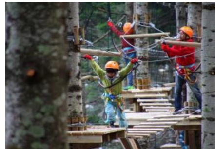
アドベンチャーパーク