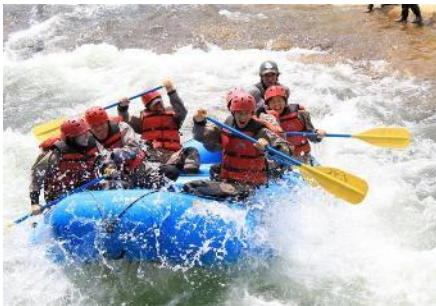
ニセコラフティング