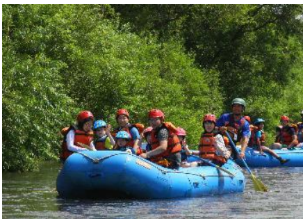
ファミリーラフティング