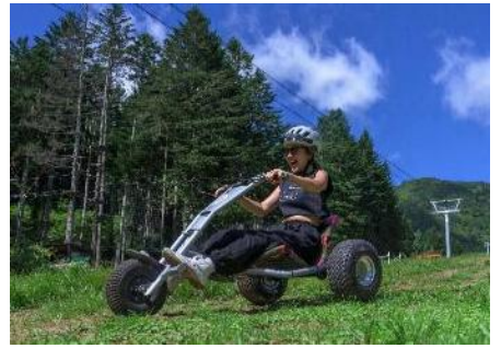
マウンテンカート