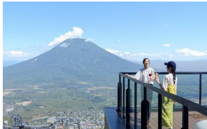
YOTEI SKY TERRACE