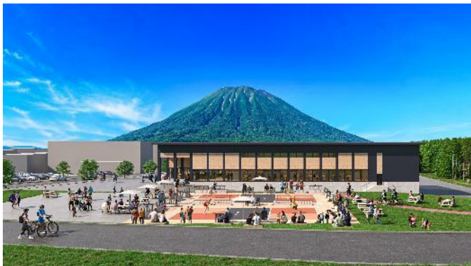
ピックルボールコート（イメージ）