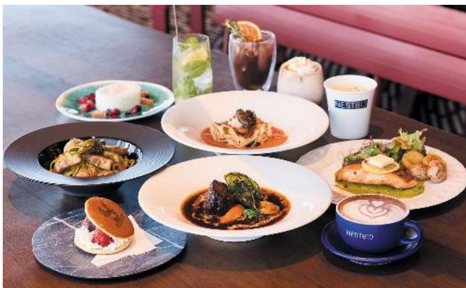
NEST813 メニューイメージ

【営業時間】カフェ8：30～16：00（15：30L.O.）／ランチ11：00～14：30