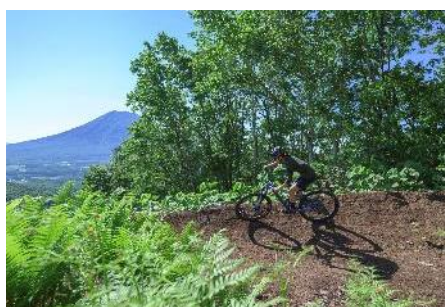
MTB BIKE PARK