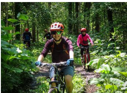
マウンテンバイクツーリング