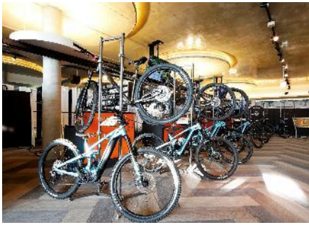
レンタルバイク(マウンテン、ロード)