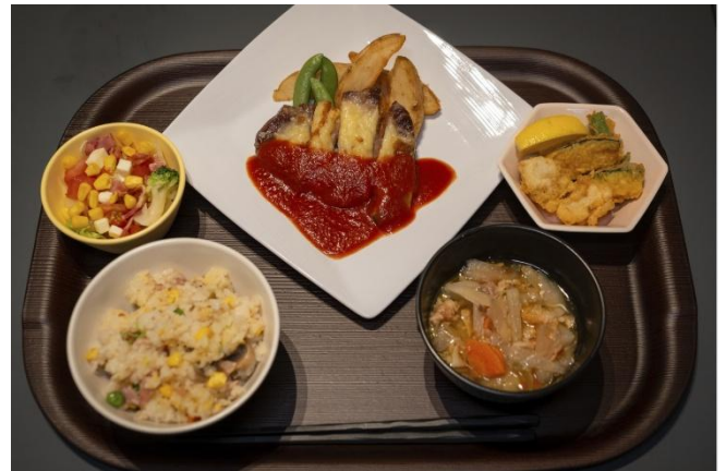
イベント当日のディナーメニュー