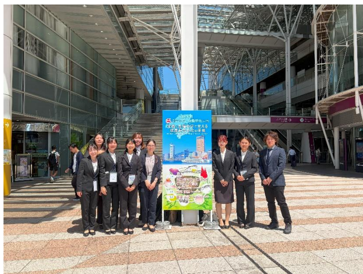
授賞式当日の様子