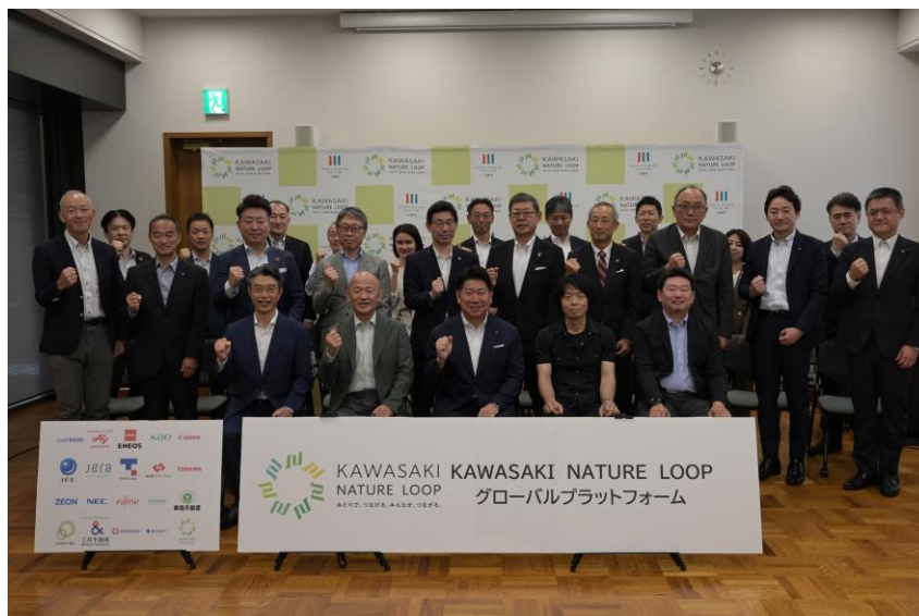
ネイチャーポジティブの実現に向けて市内の企業など 19 社との協働による新たな枠組み「KAWASAKI NATURE LOOP グローバルプラットフォーム」を設立（川崎市役所にて）

東急不動産株式会社（本社：東京都渋谷区、代表取締役社長：田中 辰明、以下「東急不動産」）は、川崎市が市内に立地する民間企業など 19 社との協働により、自然と都市が共に成長する持続可能な好循環の創出に向けて 7 月 8 日に設立した新たな枠組み「KAWASAKI NATURE LOOP グローバルプラットフォーム（以下、本プラットフォーム）」へ参加します。本プラットフォームは、みどりと生物多様性の評価に関する議論を中心に行う、全国初の取り組みです。