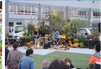
共創によるフェス開催

▶レガシーとしてめざす「みどりの将来像」策定（令和8年3月） ・世界的な潮流を意識しながら、フェアを契機に次の100年のめざすべき方向性を示す将来像を策定しました。 ・みどりの将来像は、関連する個別計画の上位概念として2050年のあるべき姿を示すもので、多様な主体が自ら「緑のつながり」「人のつながり」「みどりを活かしたまちづくり」の3つの柱を成長させ、みどりの価値を最大限に引き出し、好循環により自然と都市が共に成長し続ける川崎をめざします。 ・「みどりの将来像」に示す3つの柱の成長と好循環を持続させるためには、市民・企業・団体・大学・金融機関など、市に関わる多様な主体が自主的に参画し、主体的に取り組むことが必要であり、市全域において総合的に取組を推進し、発展させていくための仕組み（みどりのマネジメント）づくりを進めるとともに、様々な機会を捉えた情報発信や普及啓発に向けて、緑のつながりにおいては、多様な主体の連携により、現況調査やモニタリングにより緑の量や動植物調査による基礎データを収集し、データの見える化を行うなど、将来像の実現に向けた取組を推進していくこととしています。