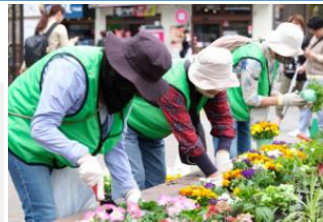
協働による花壇づくり

▶全国都市緑化かわさきフェア（令和6年度） ・秋と春の2期にわたり、全国都市緑化かわさきフェアを開催し、協働・共創により、かわさきの多様な魅力とみどりを掛け合わせ、みどりが持つ多様な機能や効果を通じて多くのつながりを生むことができました。