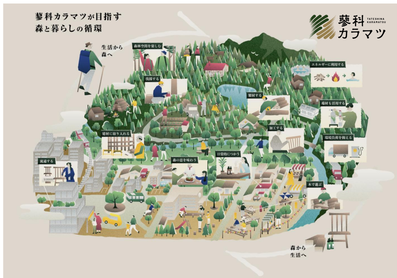
本プロジェクト概念図

カラマツを軸に、伐る・加工する・届ける・また育てるという循環を地域の仲間と連携しながら行うことで環境配慮（脱炭素、地域循環、生物多様性）を推進し、森と人が豊かに響き合う社会の実現を目指します。