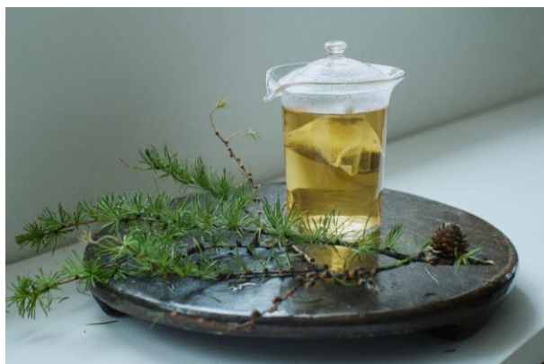
蓼科のカラマツを使用したプロダクト（左：枝を使ったアロマ、右：葉を使ったお茶）