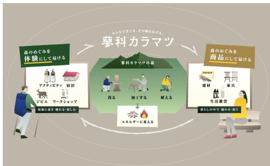
蓼科カラマツが目指す循環イメージ