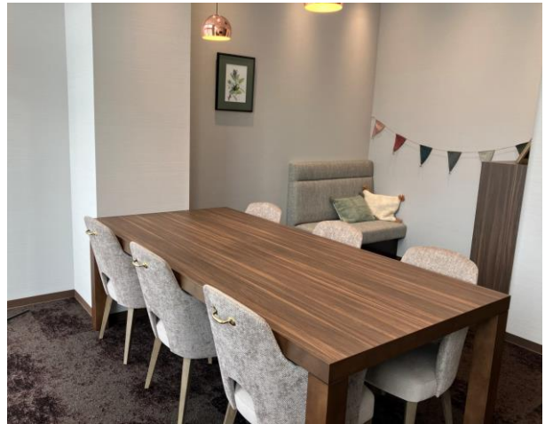
▲応接室（キッズルーム付き）

今後も当社はネットワークの充実と共に、お客様の課題に真摯に向き合い、最適な解決へ導けるよう努めてまいります。