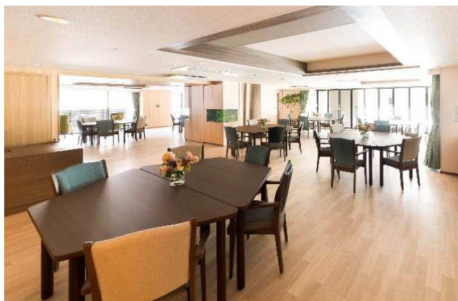
ケアレジデンス リビングダイニング

※「眠りSCAN」はパラマウントベッド株式会社が提供するマットレスの下に敷きこむシート状のセンサーで、身体に何も装着することなく呼吸数や脈拍数、睡眠状態、覚醒、起き上がり、離床動作などを遠隔でもリアルタイムで把握が可能なIoT設備です。