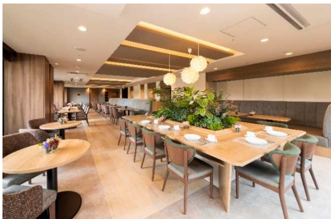
クレールダイニング