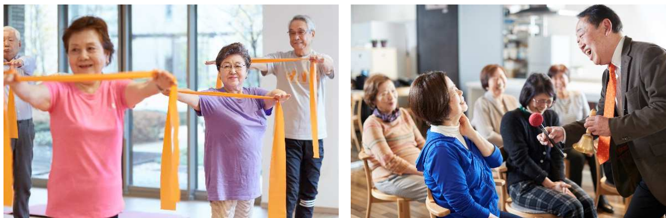
左：運動系クラス 右：文科系クラス（ホームクレール世田谷中町で撮影）