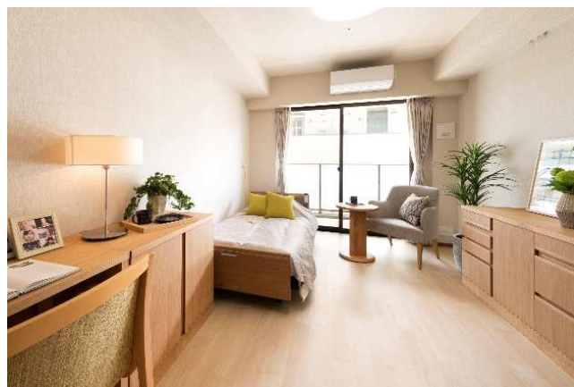
ケアレジデンス 専用居室