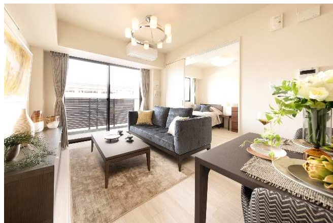
シニアレジデンス 専用居室