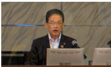
本年度の株主総会は、ライブ配信も開始