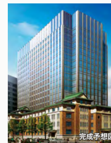
(仮称)九段南一丁目プロジェクト 東京都千代田区 プラン認証