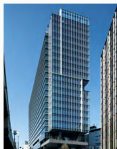
渋谷ソラスタ 東京都渋谷区