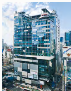
渋谷フラス 東京都渋谷区