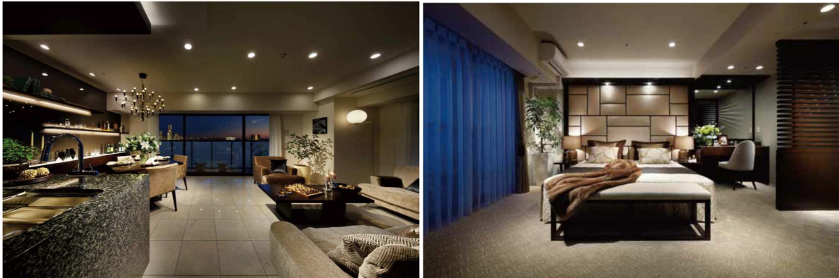
【Executive Class 90C タイプ セレクトプラン3 モデルルーム(左より)LD・Master Bedroom】

専有部では、美しく優雅なプライベート空間をテーマに設計しています。ホテルライクな内廊下設計、全邸に「トランクルーム」と、生ゴミを粉碎して水に流せる「ディスポーザー」を標準仕様とするなど、こだわりの設えで上質で快適なクオリティを実現しています。また、最上階には、専有面積約149㎡～約178㎡の広さを確保し（一部タイプはルーフバルコニー付）、プレミアム仕様の設備仕様を装備したプレミアムクラスプランを用意しています。