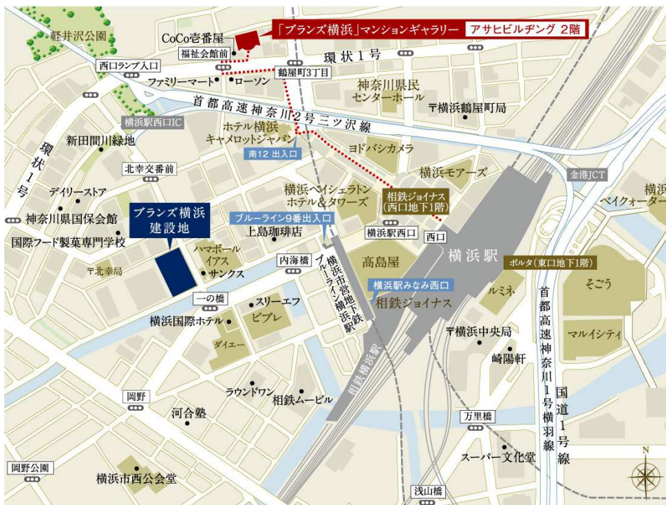
【現地・マンションギャラリー案内図】