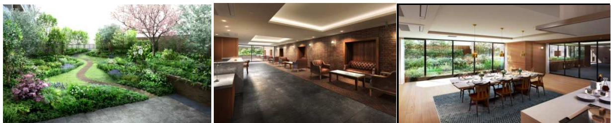
【左より）オーナーズガーデン・オーナーズラウンジ・ガーデンビューサロン CG】

「オーナーズガーデン」「オーナーズテラス」だけでなく、「オーナーズガーデン」を借景に、邸宅のゆとりに堪能する「オーナーズラウンジ」や、パーティーも愉しめる「ガーデンビューサロン」など、機能性を重視した共用部を設けました。