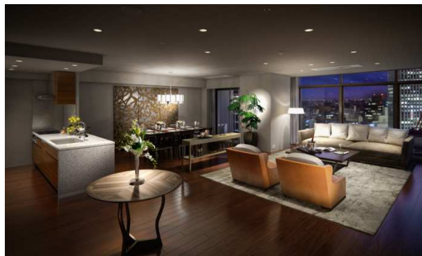
【Premium Class 170A タイプ LD 完成予想 CG】