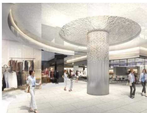
<3 階フロア環境イメージ>

路面部分には、伝統を受け継ぎながらも革新的なスタイルを提案する、上質で多彩なブランドのグローバル旗艦店が集結し、銀座に新たなブランドストリートが誕生します。また、東急百貨店の新セレクトストアや東急ハンズの新業態、都内最大となる市中空港型免税店「ロッセ免税店銀座」等も出店し、国内外のお客様のアーバンショッピングライフスタイルを満たす次世代型のラインアップとなっています。