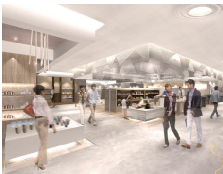
<6 階フロア環境イメージ>