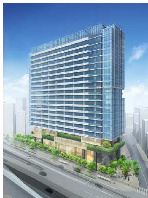
(仮称) 南平台プロジェクト外観イメージ

入居企業からは、「トイレの在室状況がリアルタイムにわかり、無駄な離席がなくなることで業務効率化につながり、働き方改革の一助となる。」との声をいただいています。今後も、MyCityなどとの共創を通じ、物件やエリアの特性に合わせ、働き方改革をサポートするサービスプラットフォームを展開してまいります。