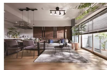
ルームデコレーション(有償)