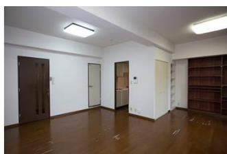
既存のお部屋(リフォーム前)