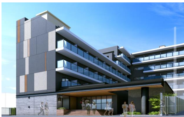
CAMPUS VILLAGE 椎名町 完成予想図