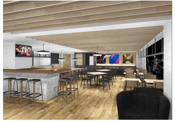
カフェテリア(1階) 完成予想図

本物件は、西武池袋線「椎名町」駅より徒歩9分、都営大江戸線「落合南長崎」駅より徒歩10分と都心にもアクセス良好な学生レジデンスです。また、居住者でシェアするリビングキッチンやカフェテリアを設けることで居住者間のコミュニティ形成を図り、東急グループ各社ソフトサービスとも連携することでワンルームマンションとの差別化を図ります。