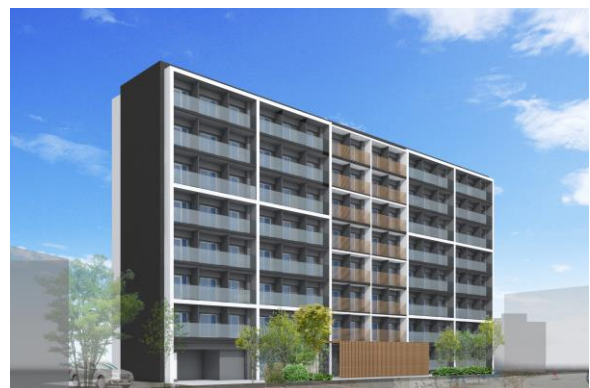
北区志茂三丁目プロジェクト 完成予想図