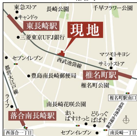
CAMPUS VILLAGE 椎名町