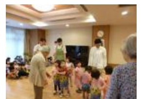
シニア世代と子供たちの ふれあい(イメージ)