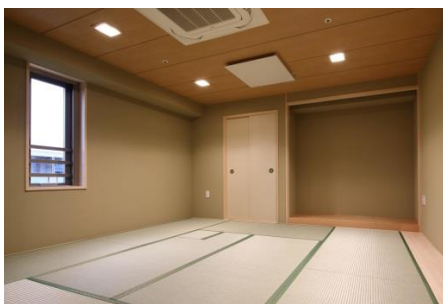
カルチャールーム内観

「プランズ」「グランクレール」の両居住者が利用できる、茶道教室などでもできる和室と、ピアノを設置した音楽室の2つのカルチャールームを設置。グランクレールに入居するシニアの方が身につけた文化や教養を、プランズに入居している親子世代に教えるプログラムを行うなど、居住者同士の交流を育みます。