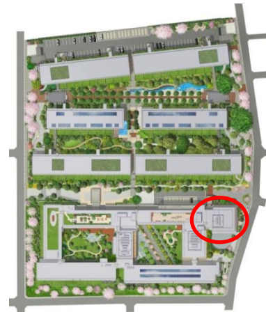
コミュニティプラザ 位置図