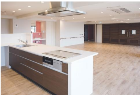
ナースケアリビング世田谷中町内観

また、施設の内装デザインにおいても、併設するグランクレール世田谷中町ケアレジデンス同様、認知症にやさしいデザイン ※3 を導入しています。