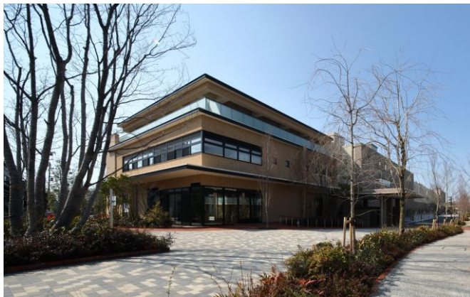
コミュニティプラザ外観

世田谷中町プロジェクトは、東京都「一般住宅を併設したサービス付き高齢者向け住宅整備事業」第一号プロジェクトとして開発が進んでおり、このコミュニティプラザには、地域に暮らす多世代の皆様の積極的な交流促進と、地域の介護の拠点としての機能が備わっています。