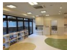
ポピンズナーサリースクール 世田谷中町内観